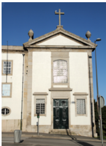
▲ Kaplica Krawców

Wracając na Rua de Saraiva de Carvalho i skręcając w Rua de Augusto Rosa,